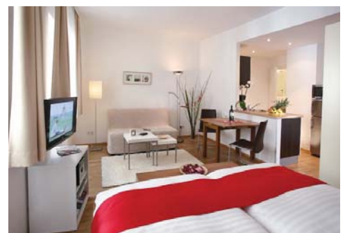
kombinierter Wohn-/Schlafrum, COMFORT

Das Apartment empfängt Sie im praktischen Vorraum mit ausreichend Staumöglichkeit wie Schuhablage, Kleiderschrank und Garderobe. Die voll ausgestattete Küche mit großer Kühl-Gefrier-Kombination, Geschirrspüler, einem 2-Zonen-Kochfeld, Dunstabzug und einer Mikrowelle machen Sie kulinarisch unabhängig.