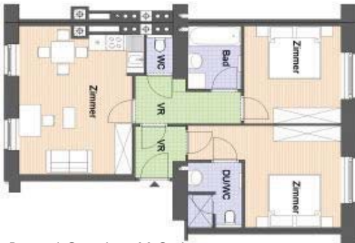
Beispiel Grundriss, X-Ordinary